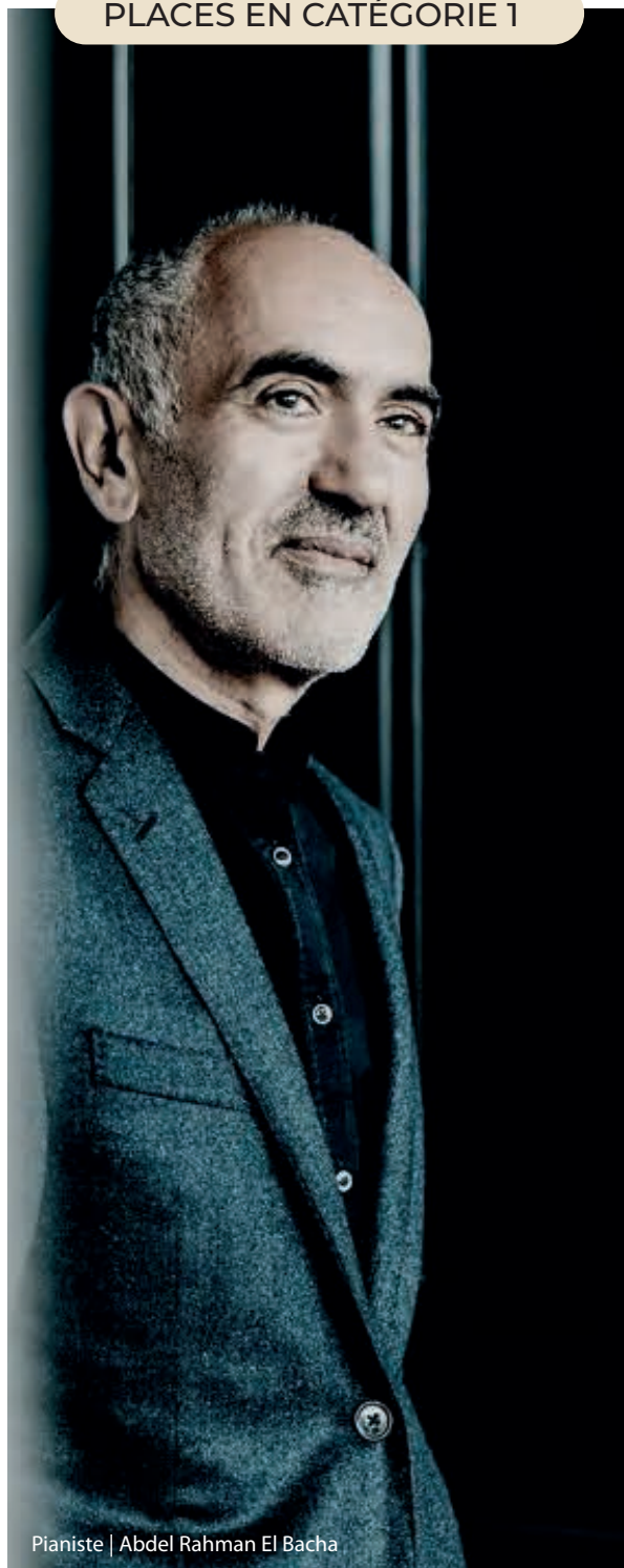
Pianiste | Abdel Rahman El Bacha